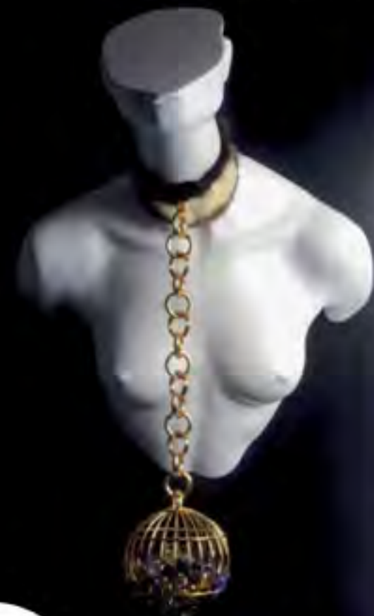
DESIGN PARESSE & AVARICE

Deux photos seront placées en vis-à-vis. Parce que le bâillement est communicatif ? Paradoxe : si à l'expo tout le monde se met à bâiller, ce sera une réussite.